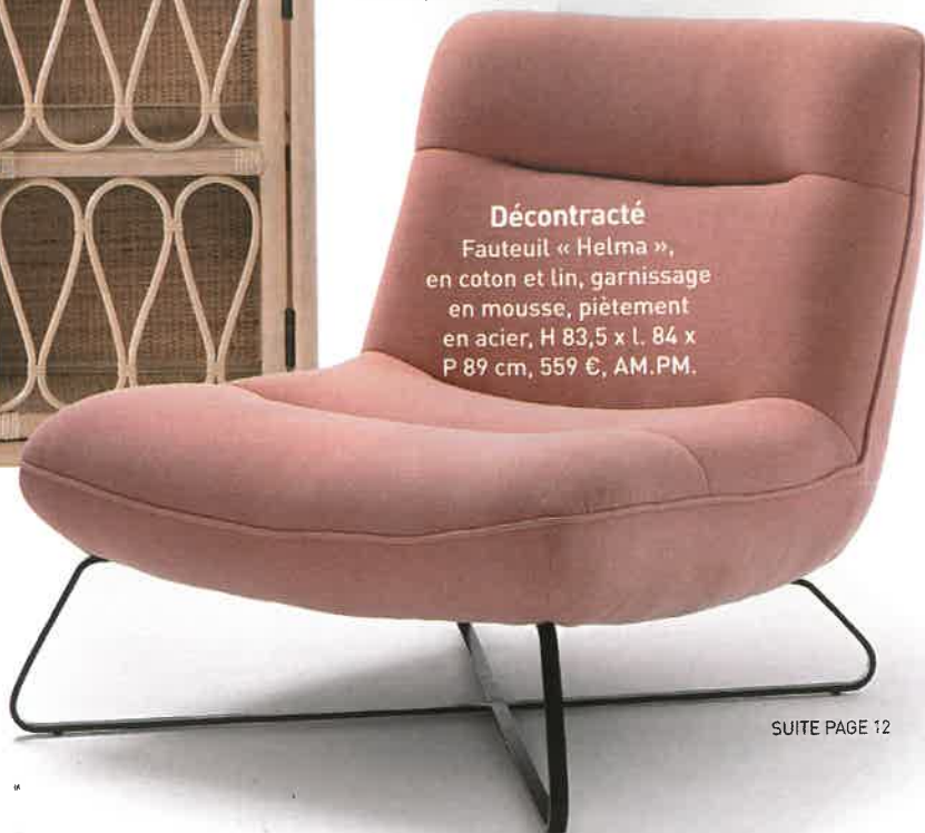
Décontracté Fauteuil « Helma », en coton et lin, garnissage en mousse, piètement en acier, H 83,5 x l. 84 x P 89 cm, 559 €, AM.PM.