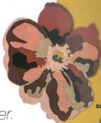
Composition « Bloom 2 Nectar », superposition de 2 tapis en laine, 170 x 150 cm (fleur) et 240 x 170 cm, 3075 €, Nanimarquina sur Éttoffe.com