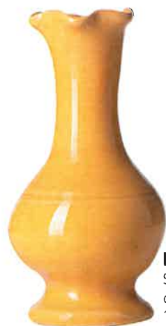
Mini Soliflore, en terre cuite, H 12 cm, 15 €, Casa Lopez.