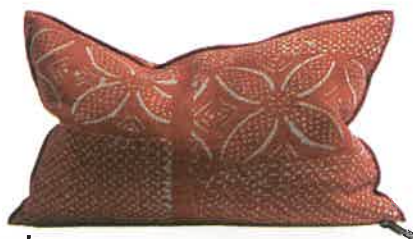
Brut Coussin « Vice Versa Bogolan », en lin wabi sabi, coloris Henné, 7 coloris disponibles, 50 x 30 cm, 123 €, Maison de Vacances.