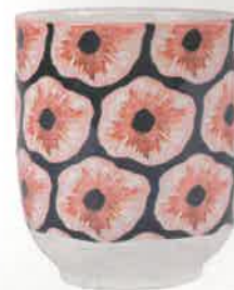
Pop Gobelet « Aqua », en porcelaine, 24 € le lot de 4 (motifs différents), Jardin d'Ulysse.