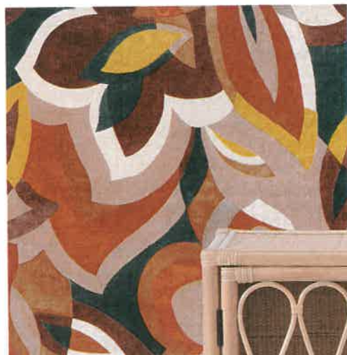
XXL Tissu « Jardin de Cézanne », en lin, l. 129 cm, 159 € le mètre, Misia.