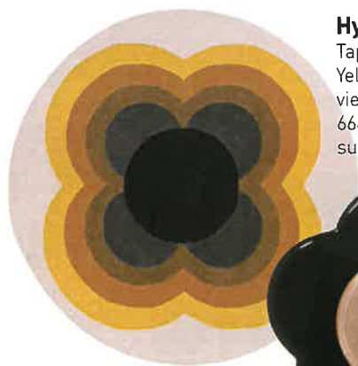
Hypnotique Tapis « Sunflower Yellow », en laine vierge, Ø 150 cm, 664 €, Orla Kiely sur Éttoffe.com