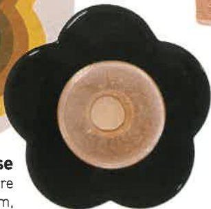
Précieuse Applique « Clover », en verre de Murano soufflé, Ø 30 cm, 1800 €, India Mahdavi.