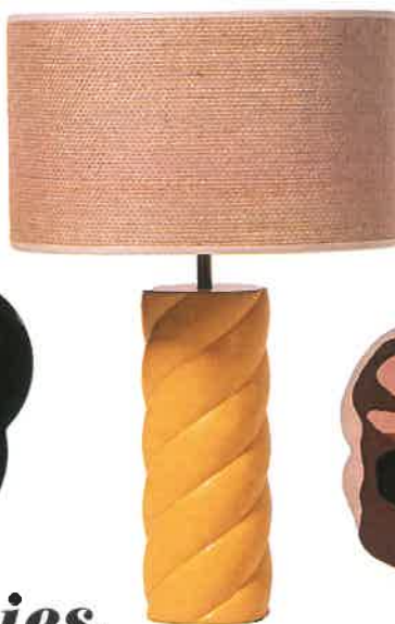
Bois tourné Lampe à poser « Mallow », en érable et abat-jour en jute, Ø 32 x H 50 cm, 380 €, Goodmoods.