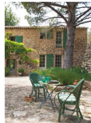
Le vaste jardin permet d'accueillir plusieurs espaces de détente. Tous sont traités avec style. Mobilier de jardin, chiné à Saint-Rémy-de-Provence.